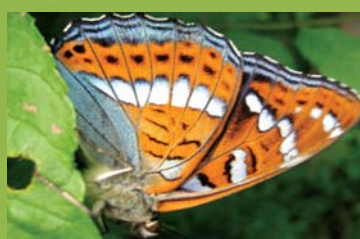
La Nymphale du Peuplier