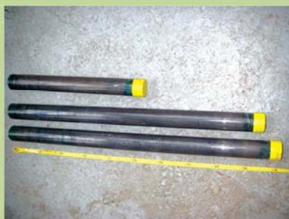
Carottage de sédiments