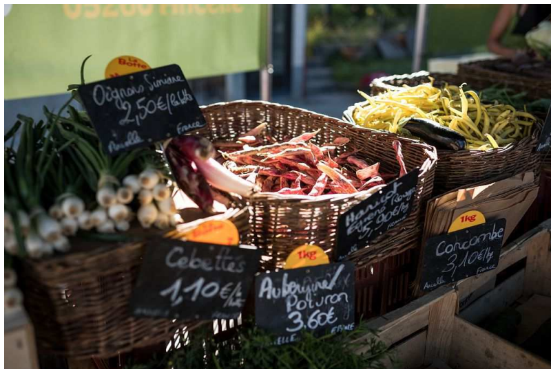
Légumes au marché