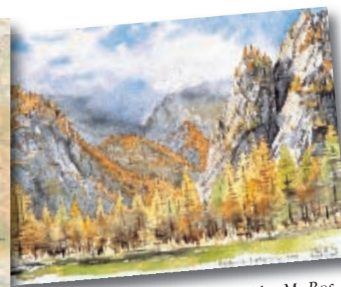
Ailefroide, M. Bos