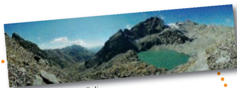
Lac de l'Eychauda, F. Belin