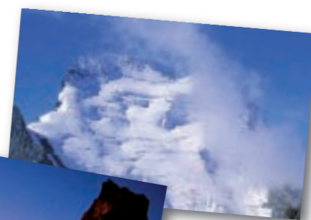
Les Ecrins, R. Chevalier