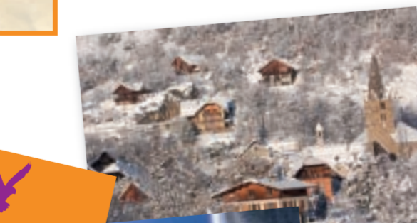
Vallouise, T. Maillet