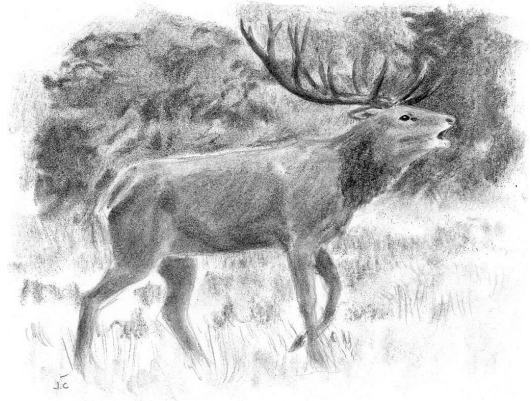
Le cerf élaphe