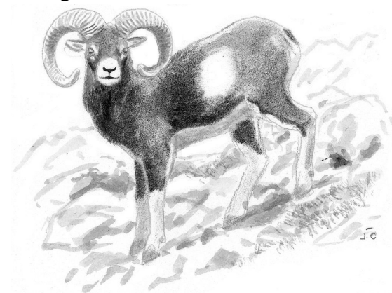
Le mouflon méditerranéen