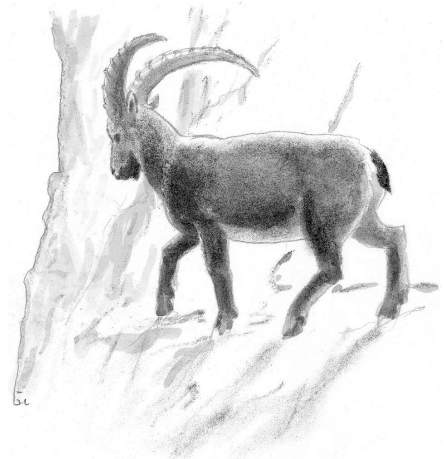
Le bouquetin des Alpes