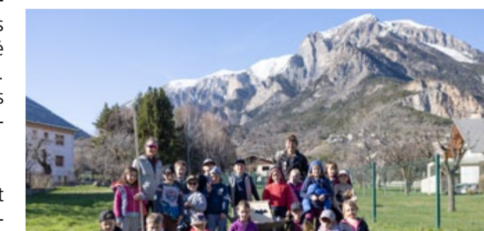
Les CP-CE1 de l'école du Rabioux installent leurs nichoirs !

Cet outil a bénéficié du financement du projet franco-italien Biodiv-TourAlps. Il est commun aux sept espaces protégés impliqués dans le projet : les Parcs nationaux des Écrins, de la Vanoise, du Mercantour et du Grand Paradis, et les Parcs naturels Alpi Liguri, Alpi Marittime et Alpi Cozie.