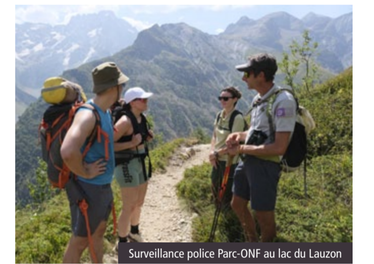
Surveillance police Parc-ONF au lac du Lauzon

des journées de contrôles renforcées par l'OFB (Office Français de la Biodiversité), la Gendarmerie ou l'ONF (Office National des Forêts), et peuvent donner lieu à des contraventions. Depuis 2025, le Parc national maintient un effort particulier en matière de police afin d'enrayer les comportements problématiques. Entre 2024 et 2025, le nombre de contraventions a ainsi été multiplié par quatre (107 procédures ont concerné le bivouac).