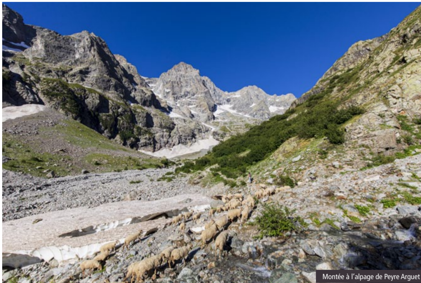
Montée à l'alpage de Peyre Arguet

L'ONU (Organisation des Nations Unies) a fait de 2026 l'Année internationale des parcours et des éleveurs pastoraux. L'objectif : renforcer ces écosystèmes et soutenir les populations qui les préservent. Dans le massif des Écrins, le pastoralisme est une composante indissociable du territoire, mêlant histoire, économie et biodiversité. Depuis sa création, le Parc national œuvre pour le maintien de cette activité dans le respect des milieux naturels.