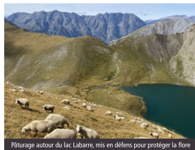
Pâturage autour du lac Labarre, mis en défens pour protéger la flore

Depuis le retour du loup, qui dit troupeau dit souvent chiens de protection. Sur les alpages, il est parfois difficile pour les randonneurs de cohabiter avec ces chiens massifs qui viennent au contact en aboyant (même s'il s'agit du comportement habituel de dissuasion). Une série de vidéos produites par le Parc national des Écrins et l'IDELE (Institut de l'élevage) est à découvrir cet été sur les réseaux sociaux du Parc. Son but : donner au grand public les clés pour comprendre le langage et l'intention d'un chien quand il s'approche. Cette série vient compléter les vidéos déjà existantes sur les bons gestes à appliquer à proximité des troupeaux.