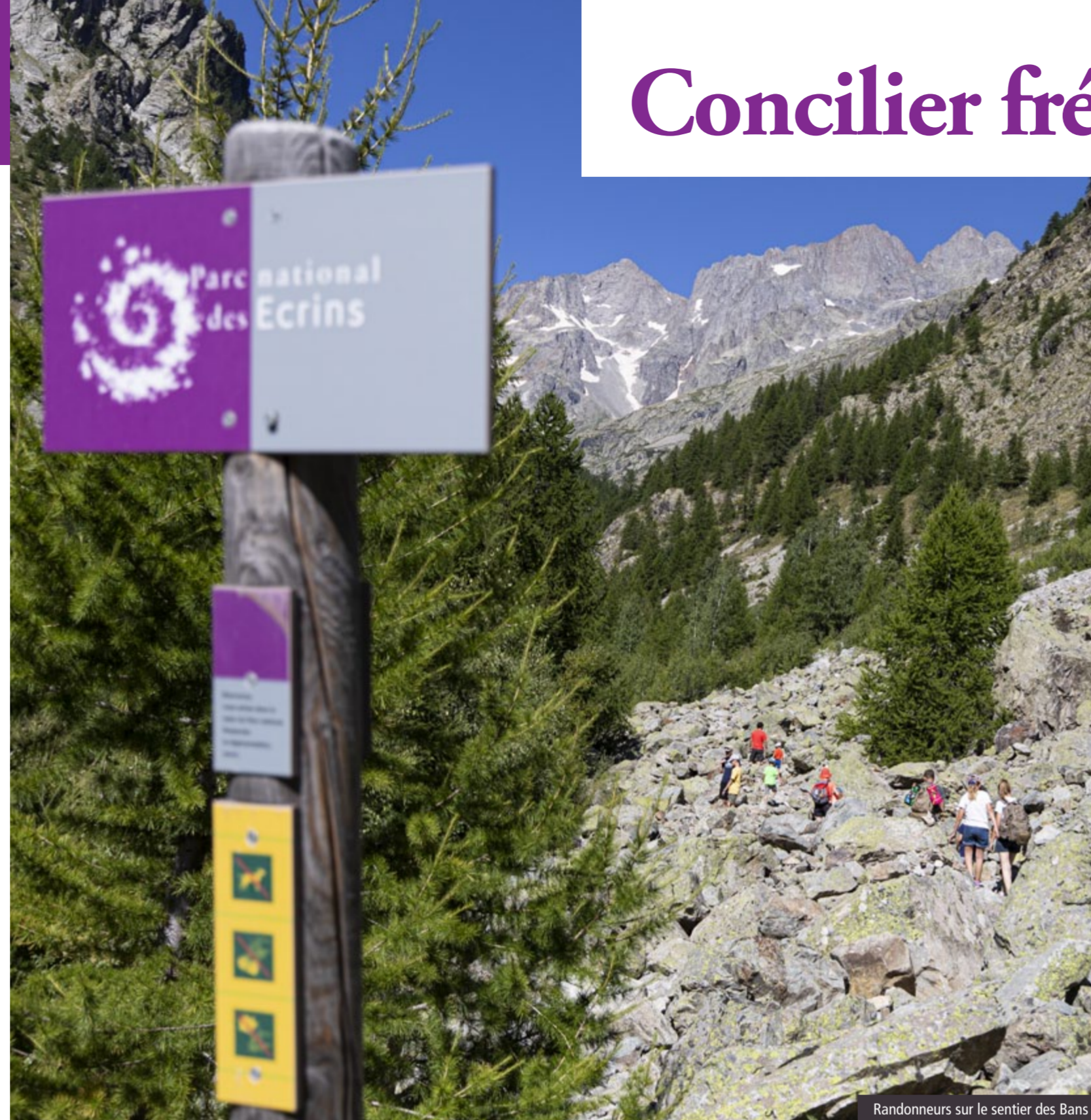
Randonneurs sur le sentier des Bans

Au sujet de la baignade, les impacts sont plus incertains. « C'est une histoire de seuil », commente Clotilde Sagot. Une personne qui va se baigner dans un lac de montagne pendant l'été n'a pas le même impact que 25 baigneurs par jour. Ce seuil dépend à la fois du niveau de la fréquentation et, pour les milieux aquatiques, du volume du plan d'eau ou du débit du ruisseau. Il faut également bien dissocier contamination et pollution des milieux : si la contamination désigne l'apport par l'homme de substances extérieures au milieu naturel (plastiques, chimiques ou corporelles), la pollution implique un impact négatif. « On sait que les lacs d'altitude sont contaminés », confirme Clotilde (voir l'article en page 2), mais à des doses si faibles qu'on ne peut pas parler de pollution pour le moment. Mais les études n'en sont qu'à leur début ; on n'a pas encore exploré l'effet cocktail des différents contaminants par exemple. »