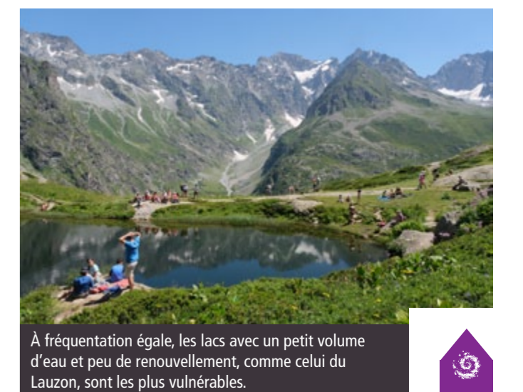
À fréquentation égale, les lacs avec un petit volume d'eau et peu de renouvellement, comme celui du Lauzon, sont les plus vulnérables.

sés, capables de relayer ces messages auprès de communautés pratiquant les activités de pleine nature. Cela nous permet de toucher plus directement les randonneurs moins expérimentés et de promouvoir une pratique respectueuse des milieux naturels et une bonne préparation des sorties.