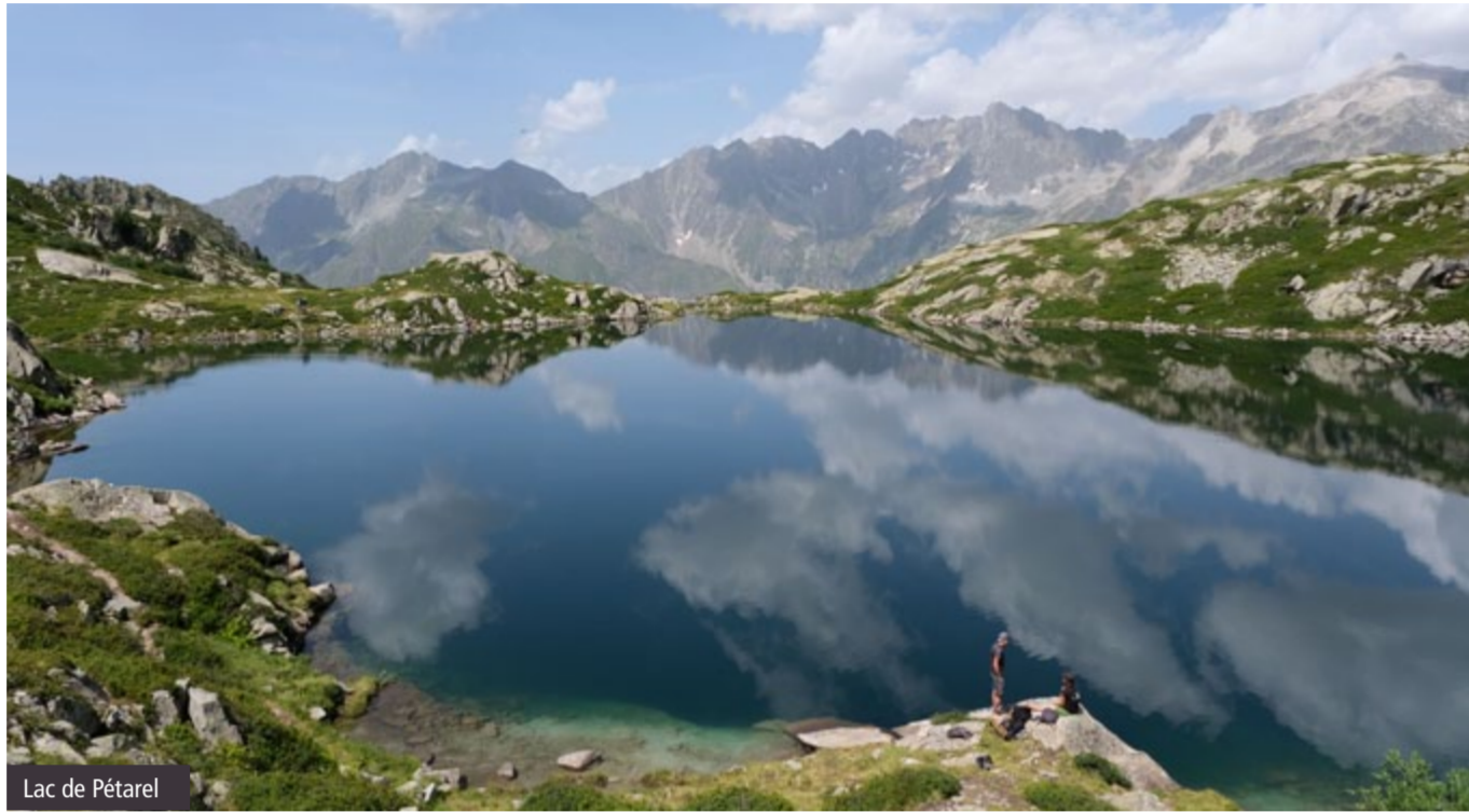
Lac de Pétarel

Aux impacts liés au changement climatique s'ajoute l'attrait renouvelé du grand public pour la montagne. Les lacs sont des destinations de randonnée qui ont la cote, et la forte fréquentation conjuguée à l'intensification de pratiques comme la baignade et le bivouac, sont autant d'éléments qui accentuent la pression sur les lacs. Pour mieux communiquer auprès des adeptes des lacs, plusieurs espaces naturels protégés dont le Parc national des Écrins, s'intéressent à leur profil via des enquêtes sociologiques. C'est l'un des volets du projet PLOUF, et les premiers résultats sont parfois à contre-courant des idées reçues. Les 579 randonneurs interrogés dans les Écrins pendant les étés 2024 et 2025 sont des personnes plus diplômées et aux revenus plus importants que la moyenne des Français. Par ailleurs, l'étude ne semble pas détecter d'effet des réseaux sociaux sur la fréquentation des lacs, sauf peut-être pour les lacs du Lauvitel et de la Muzelle. Ces résultats seront consolidés et complétés par une étude auprès des acteurs du territoire en 2026.