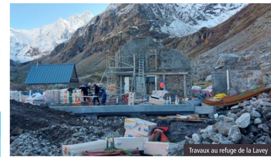
Travaux au refuge de la Lavey