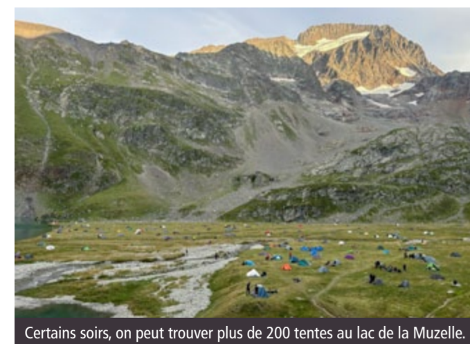
Certains soirs, on peut trouver plus de 200 tentes au lac de la Muzelle.

La vraie nouveauté des dernières années réside plutôt dans l'évolution des publics et des pratiques. « Une partie des visiteurs du parc national, plutôt urbains, continue à découvrir la montagne et a besoin d'être sensibilisée à la protection de la biodiversité », précise Pierrick Navizet. Certaines activités, limitées voire marginales jusque là, se développent, en particulier autour des lacs d'altitude : c'est le cas du bivouac ou de la baignade. Même s'ils sont contraints par les conséquences du réchauffement climatique, l'alpinisme et le ski de randonnée sont également en plein boom. En Vallouise, les données de fréquentation du Parc national, de la FFCAM et du réseau Refuges sentinelles permettent de chiffrer cette tendance depuis trois ans : + 69 % de pratiquants pour l'alpinisme, + 296 % de pratiquants pour le ski de randonnée.