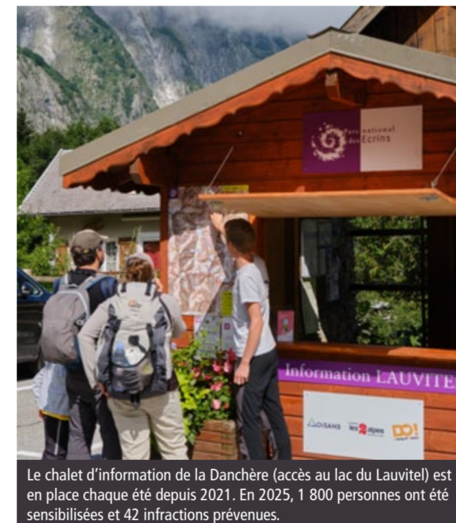
Le chalet d'information de la Danchère (accès au lac du Lauvitel) est en place chaque été depuis 2021. En 2025, 1 800 personnes ont été sensibilisées et 42 infractions prévenues.

Si la sensibilisation et la pédagogie sont au cœur des missions des gardes-moniteurs, elles ne suffisent pas toujours à empêcher les infractions. Celles-ci sont détectées grâce à des tournées de surveillance régulières et