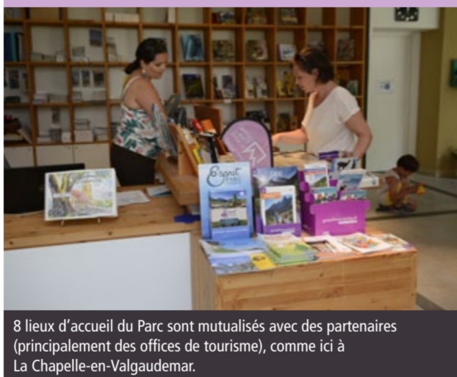
8 lieux d'accueil du Parc sont mutualisés avec des partenaires (principalement des offices de tourisme), comme ici à La Chapelle-en-Valgaudemar.