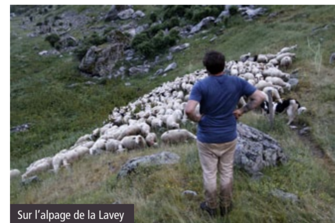
Sur l'alpage de la Lavey

Comme les animaux ont beaucoup d'espace et se nourrissent de plantes variées, il y a moins besoin de médicaments. » Les troupeaux du massif sont élevés essentiellement pour la viande, notamment celle des tardons, les agneaux qui se nourrissent de l'herbe des alpages. Une belle spécificité qui alimente l'économie locale et les circuits courts.