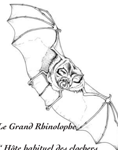
Le Grand Rhinolophe

En été, la femelle met au monde un petit, rarement deux, qu'elle allaite pendant un mois. Les premiers jours, le jeune, nu et aveugle, reste accroché au ventre de sa mère et tête presque en permanence. Au bout de quelques jours, il fait sa toilette seul et, vers l'âge de 5 semaines, il apprend à voler et à se nourrir.