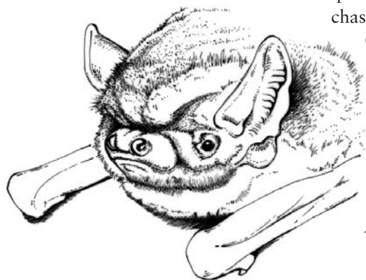
La Sérotine bicolore

“ Cette espèce nordique se rencontre, en France, principalement dans l'arc alpin ”.