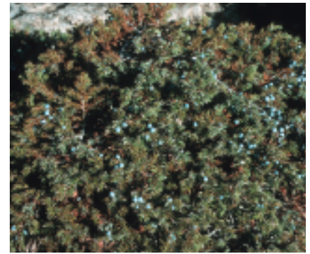
Genévrier nain

Il existe aussi un enjeu écologique indirect. Si les pelouses sont fortement colonisées par la lande, les troupeaux auront tendance à prélever plus dans l'étage alpin, ce qui serait néfaste pour ces milieux fragiles (cf. fiches pelouses alpines). Il est heureux que dans la majorité de ces cas, ces objectifs soient compatibles et en synergie.