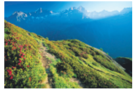
Lande subalpine

Les landes constituent un stade de végétation entre les pelouses et les forêts. Elles peuvent aussi coloniser directement les éboulis à gros blocs. Pour stopper l'évolution vers la forêt ou retourner à une pelouse, il est nécessaire de mener des actions importantes de gestion. Ces actions sont détaillées dans le paragraphe des pratiques.