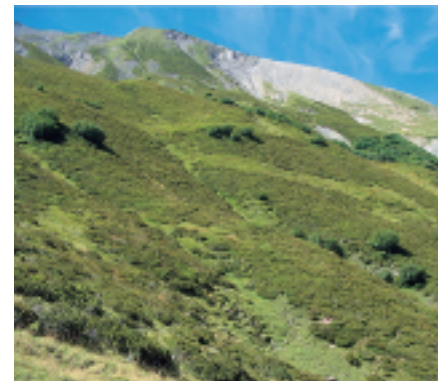
Lande débroussaillée sur l'alpage de la Lavine

- Pour les landes plus évoluées (recouvrement important de rhododendrons ou de genévriers) le débroussaillage est indispensable. Un débroussaillage des landes à rhododendron, airelle bleutée et myrtille doit impérativement être suivi d'une gestion pastorale intensive, de type gardiennage serré ou parcs de fin d'après-midi. C'est à cette seule condition que le troupeau aura un effet marqué sur le brassage et le mélange des résidus de broyats avec les éléments du sol. Le troupeau pourra alors maîtriser la progression de la myrtille et de l'airelle bleutée qui rejettent vigoureusement, ainsi que le nard raide (espèce héliophile des sols acidifiés favorisée par le débroussaillage). Dans ces conditions de gestion pastorale optimale, la part des graminées fourragères (fétuques rouge, fléole des Alpes, flouve odorante) ne pourra qu'augmenter.