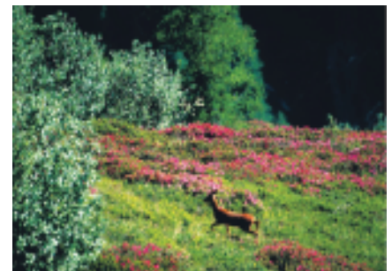
Lande subalpine d'ubac