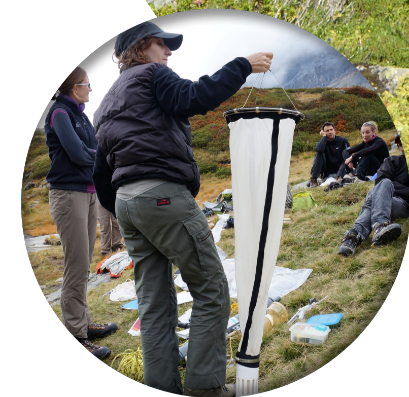
Campagne de terrain De haut en bas : * sonde multiparamètres, * prélèvement d'eau, * filet à zooplancton.