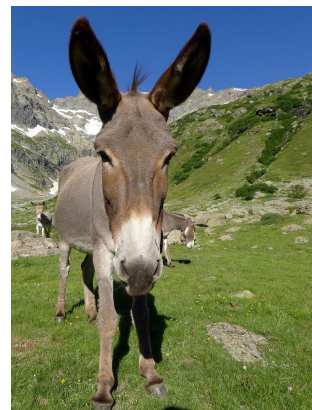
Le vallon de la Selle, l'Aiglière et le Clot Agnel Jas Lacroix