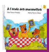
À l'école des marmottes E. Faure-Pompey, M.P. Olivier

et dans la collection Découvertes junior :