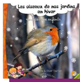
Les oiseaux de nos jardins en hivernale racontés aux enfants S. et O. Tourillon