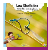
Les libellules racontés aux enfants S. et O. Tourillon