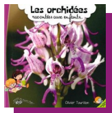
Les orchidées racontées aux enfants O. Tourillon