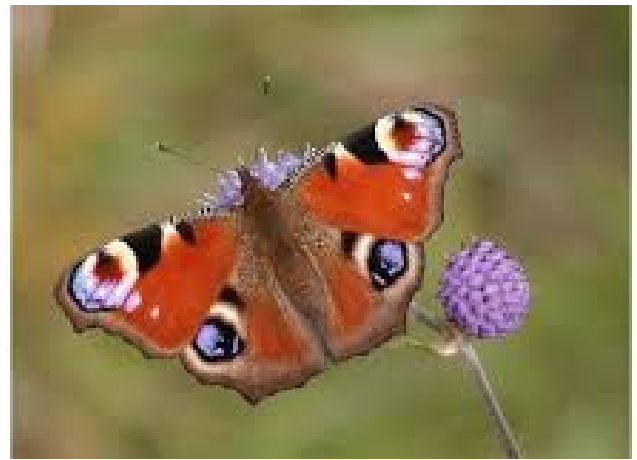
Nour, le Paon du Jour