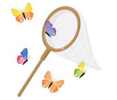
Léon, le Citron